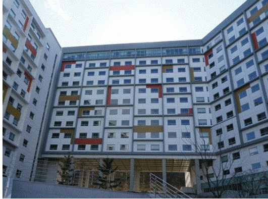
블루미르홀 (308관, 309관)